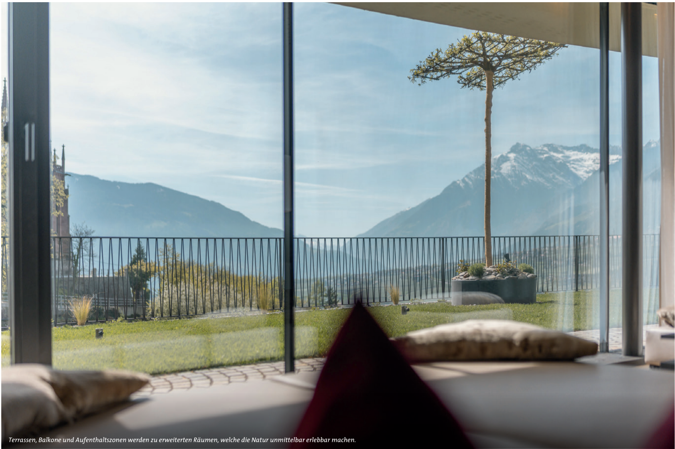
Terrassen, Balkone und Aufenthaltszonen werden zu erweiterten Räumen, welche die Natur unmittelbar erlebbar machen.