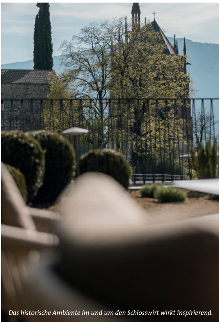
Das historische Ambiente im und um den Schlosswirt wirkt inspirierend.

mediterrane Leichtigkeit mit Ruhe und Privatsphäre verbindet. Die terrassenförmige Anlage schafft unterschiedliche Ebenen für persönliche Rückzugsmomente – ob beim Entspannen im Liege- und Ruhebereich oder bei einer willkommenen Erfrischung im azurblauen Pool direkt unter den historischen Schlossmauern von Schenna. Naturbelassenes Grün trifft auf warme Holzterrassen, mediterrane Pflanzen wie Rosmarin, Lavendel und Orangenbäumchen verbreiten einen angenehmen Duft. So entsteht eine Atmosphäre der Leichtigkeit und der Entschleunigung.