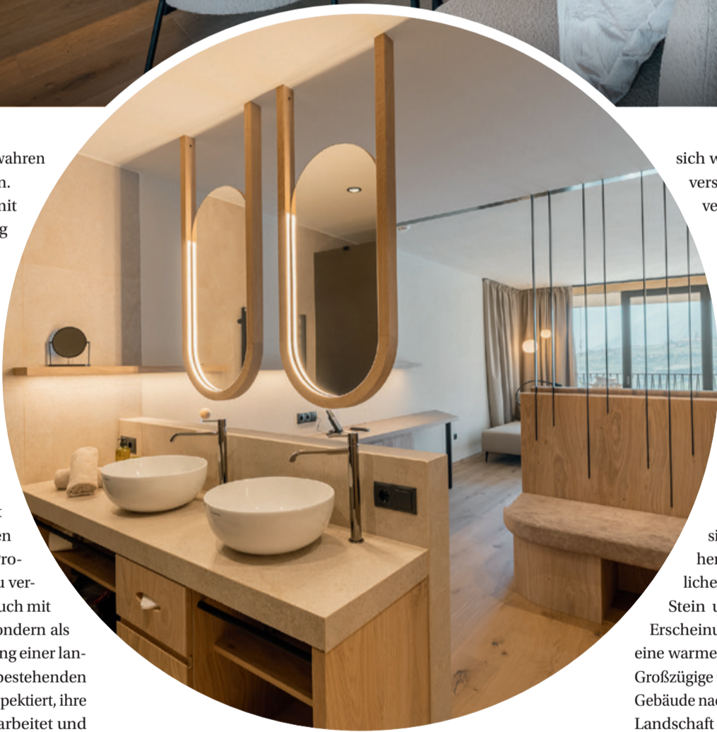
Natürliche Materialien wie Holz, Stein und Glas schaffen eine warme, zeitlose Atmosphäre.