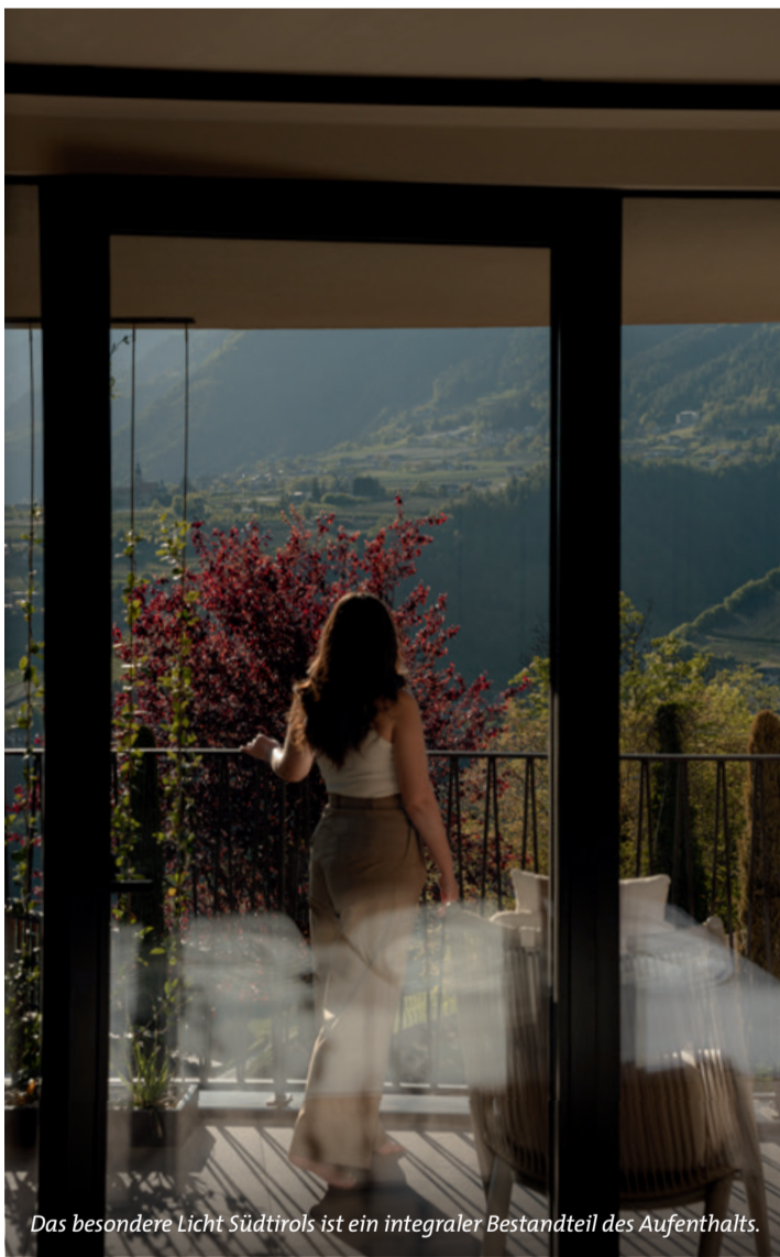
Das besondere Licht Südtirols ist ein integraler Bestandteil des Aufenthalts.

fließende Übergänge zwischen Innen- und Außenbereich – Terrassen, Balkone und Aufenthaltszonen werden zu erweiterten Lebensräumen, die die Natur unmittelbar erlebbar machen.