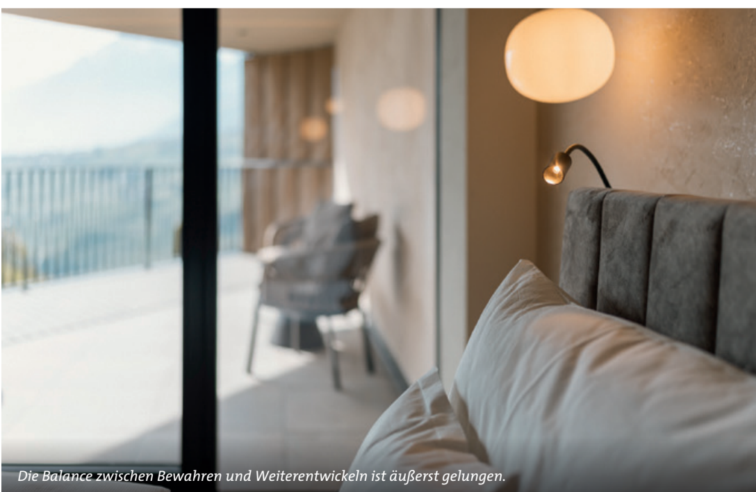
Die Balance zwischen Bewahren und Weiterentwickeln ist äußerst gelungen.