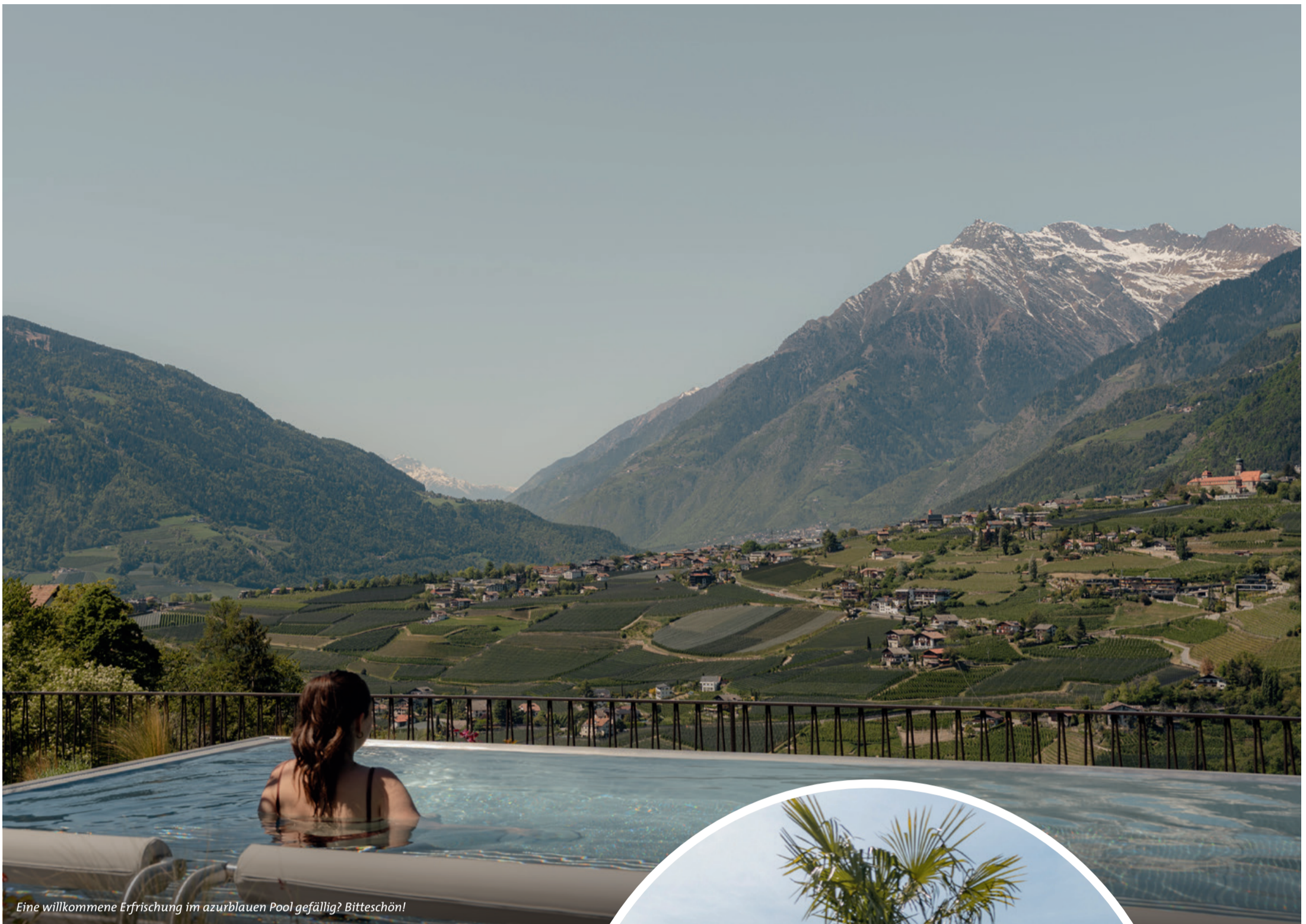
Eine willkommene Erfrischung im azurblauen Pool gefällig? Bitteschön!