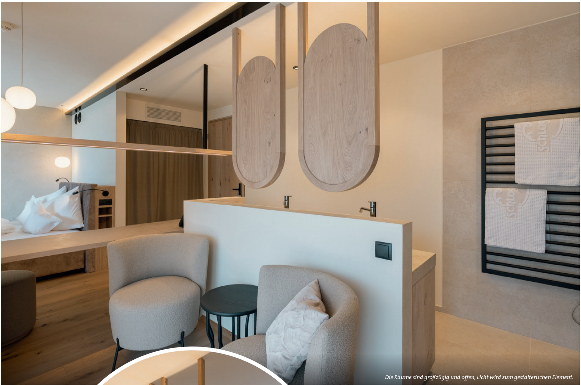
Die Räume sind großzügig und offen, Licht wird zum gestalterischen Element.

Balance zwischen Bewahren und Weiterentwickeln.