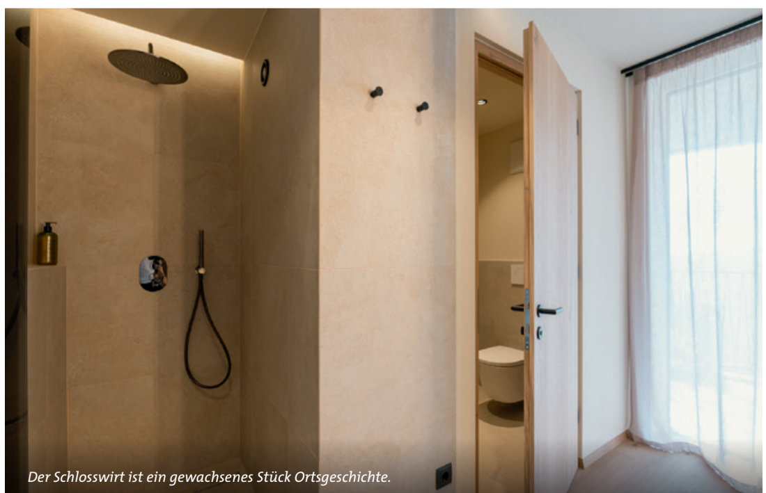
Der Schlosswirt ist ein gewachsenes Stück Ortsgeschichte.