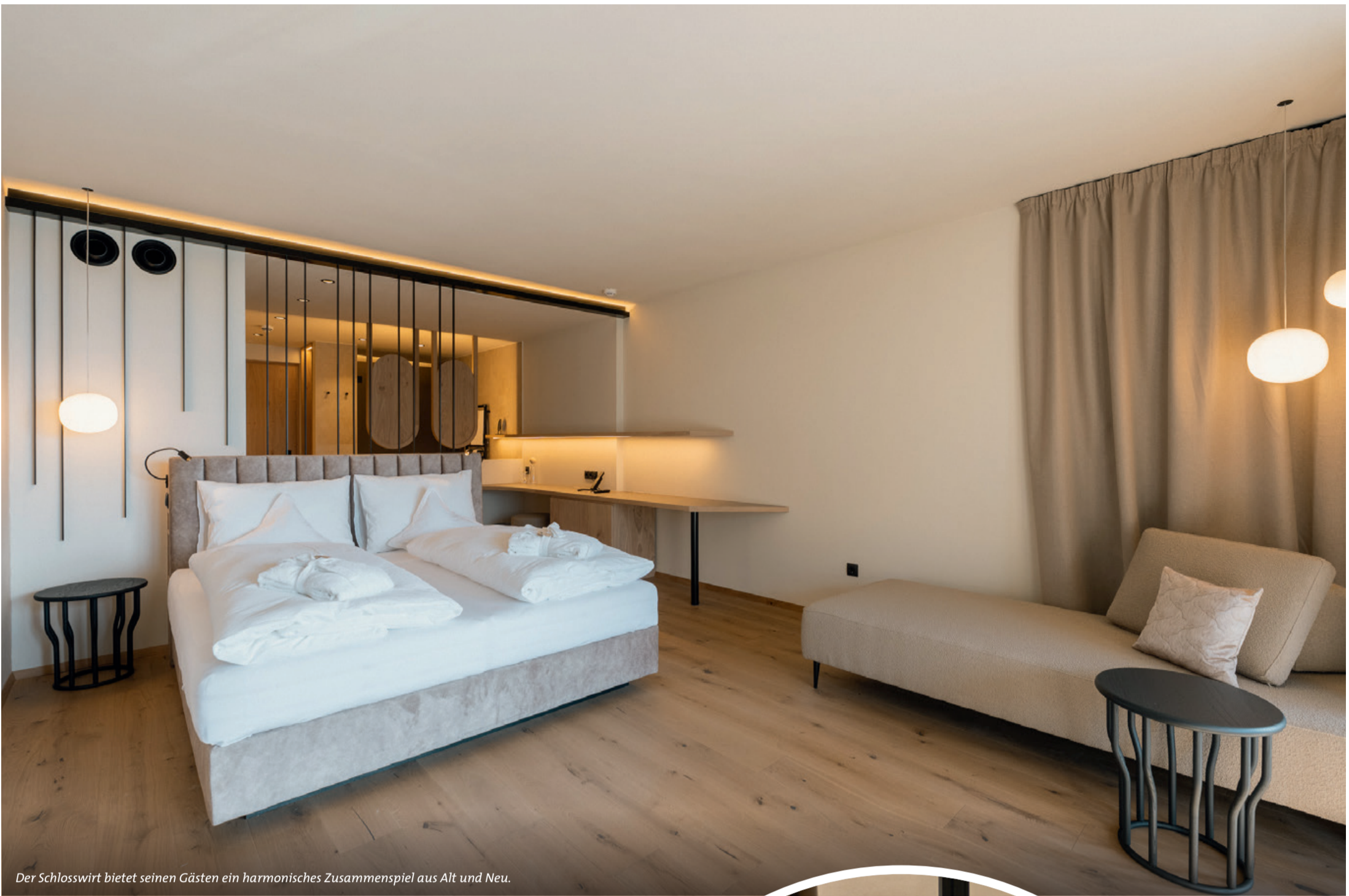
Der Schlosswirt bietet seinen Gästen ein harmonisches Zusammenspiel aus Alt und Neu.

„Unser Ziel war es, mit dieser Umgestaltung die historische Seele und den vertrauten Charme des Schlosswirts zu bewahren.“