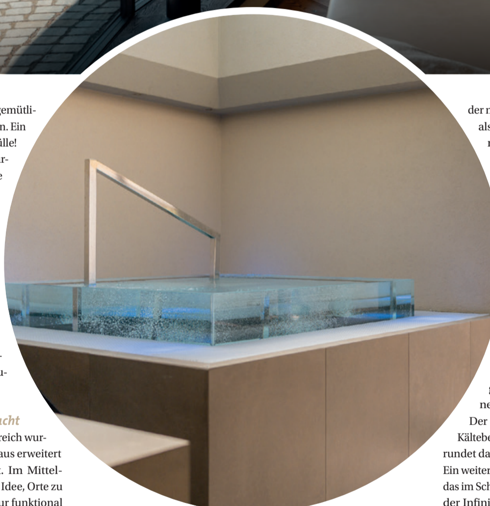
Perfektion wird erkennbar, wenn auch die kleinen Details stimmig sind.

FERTIGUNG & MONTAGE WHIRLPOOL AUS EDELSTAHL