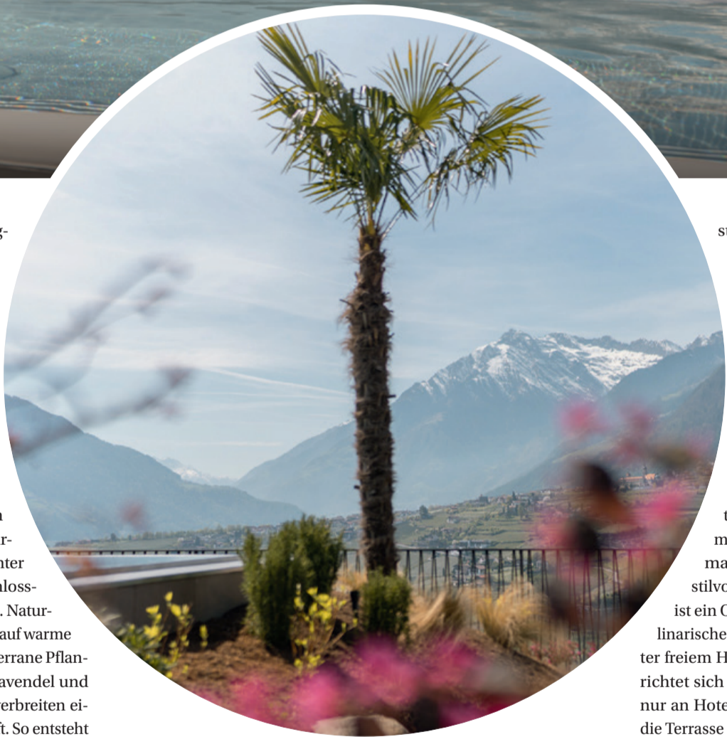
Die mediterrane Pflanzenvielfalt erzeugt eine Atmosphäre der Leichtigkeit und der Entschleunigung.

Neben den baulichen Erweiterungen spielte auch die Öffnung des Hauses nach außen eine zentrale