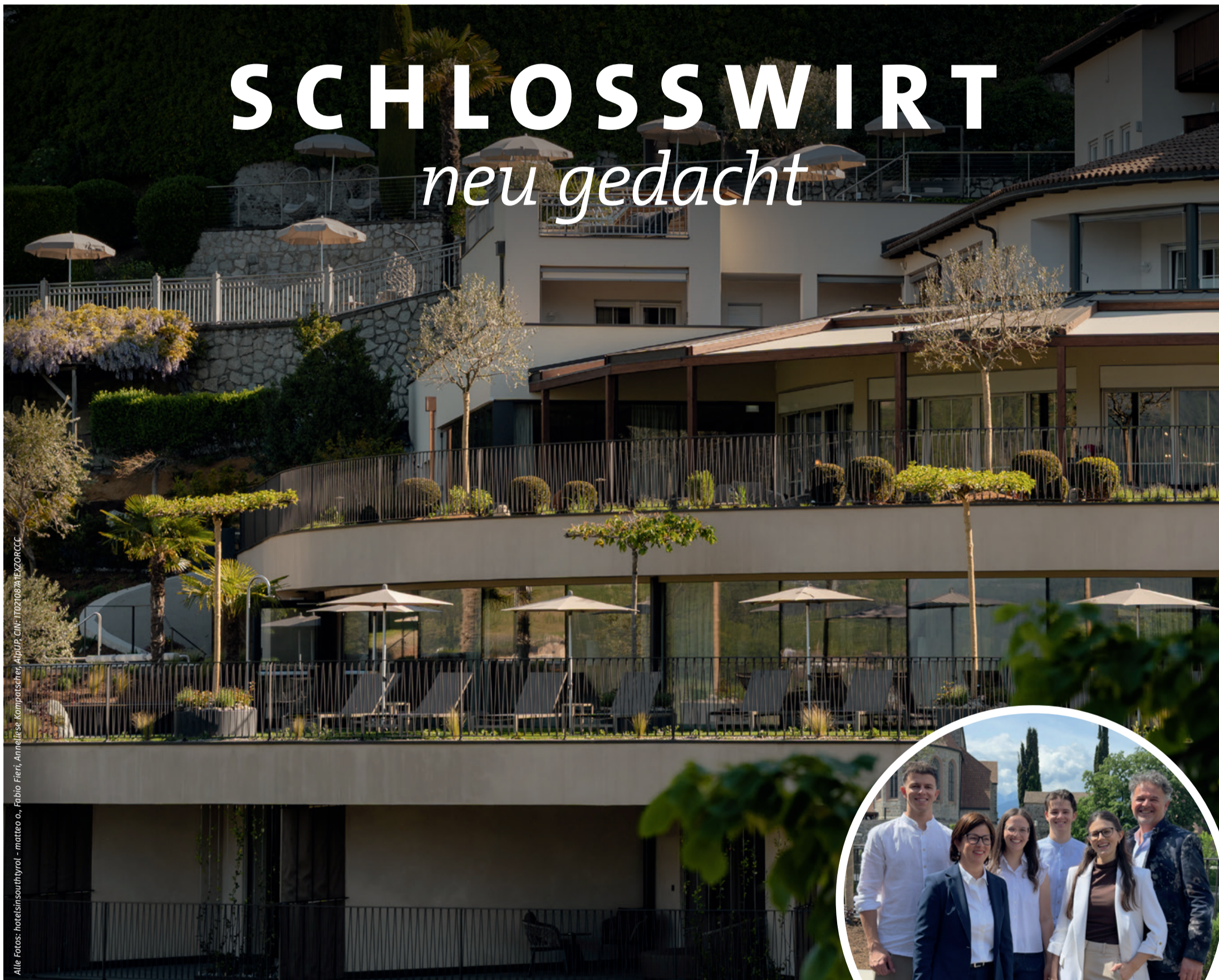
CIN: IT0210824EXORCCC