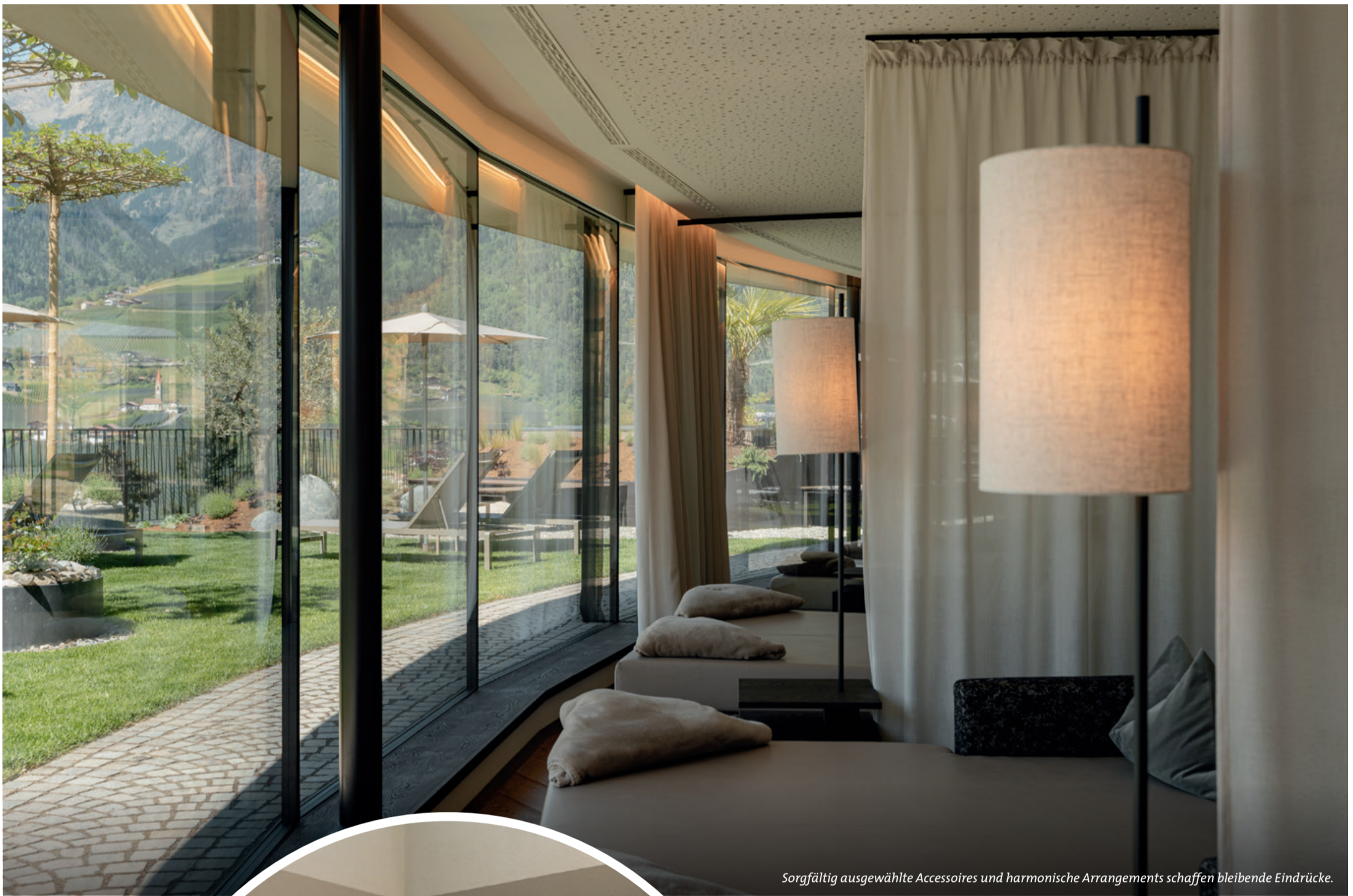
Sorgfältig ausgewählte Accessoires und harmonische Arrangements schaffen bleibende Eindrücke.

Loggia-Balkone mit gemütlichen Sitzmöglichkeiten. Ein Zuhause-Gefühl in Fülle! Bewusst geachtet wurde darauf, dass sich die neuen Zimmer nicht von der Identität des Hauses lösen. Vielmehr greifen sie bereits bestehende Elemente auf und interpretieren sie zeitgemäß. So entsteht ein harmonisches Gesamtbild, das sowohl Stammgäste als auch neue Besucher anspricht.