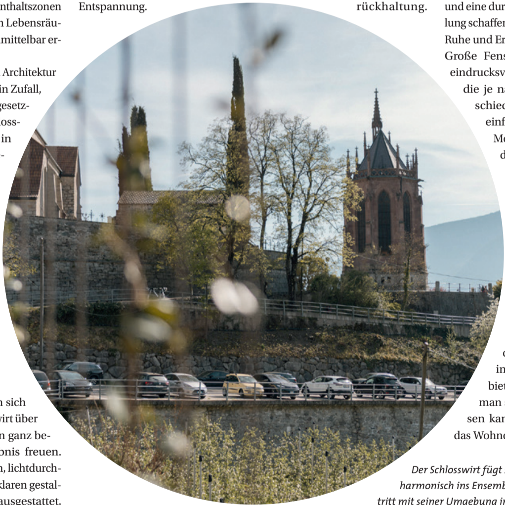
Der Schlosswirt fügt sich harmonisch ins Ensemble ein und tritt mit seiner Umgebung in Beziehung.

Große Fensterfronten eröffnen eindrucksvolle Panoramablicke, die je nach Tageszeit unterschiedliche Stimmungen einfangen – vom sanften Morgenlicht bis zum goldenen Abendhimmel. Ein besonderes Augenmerk wurde ebenso auf die Badezimmer gelegt. Auch hier wurde auf hochwertige Materialien, klare Linien und eine ruhige Gestaltung gesetzt hat. Entstanden ist ein Rückzugsort, der Wohlmomente in stilvoller Umgebung bietet. Ein Raum, in dem man sich bewusst Zeit lassen kann. Abgerundet wird das Wohnleben durch private